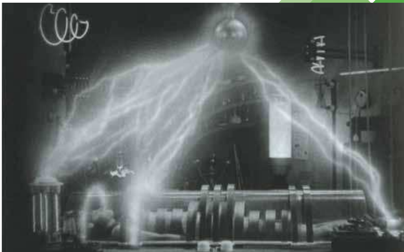
Metropolis de Fritz Lang, 1927, restauré par la Deutsche Kinemathek avec la fondation F. W. Murnau.