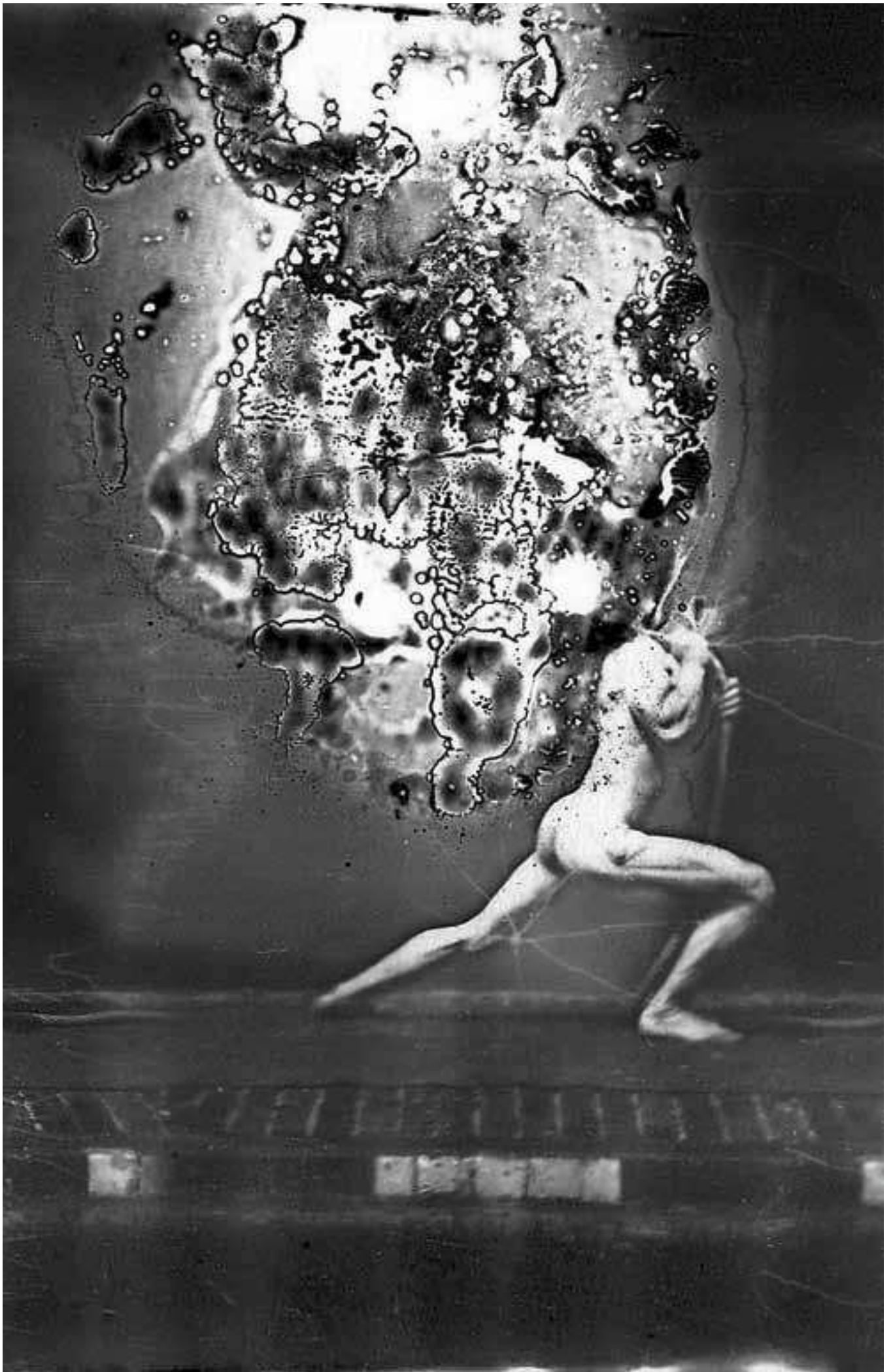
Chronophotographie E. J. Marey, 1892.