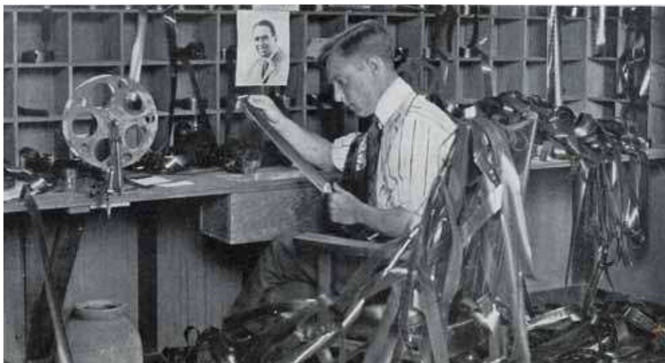
Un monteur de pellicule en 1919 aux États-Unis.

9H30/13H-14H30/18H. SALLE HENRI LANGLOIS.