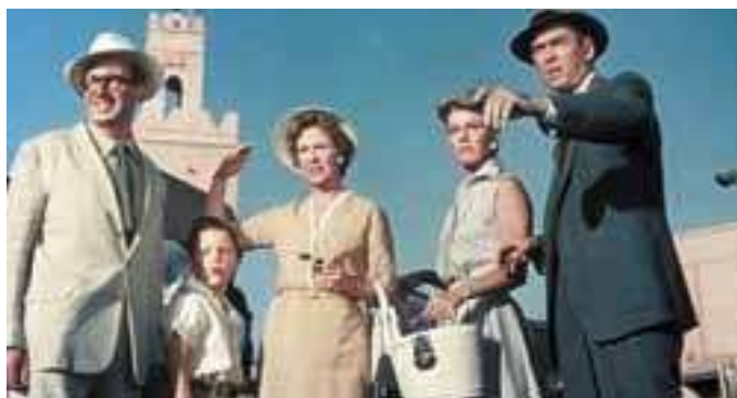
L'homme qui en savait trop , d'Alfred Hitchcock